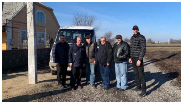
Ons team in Oekraïne

Wij danken u, bij voorbaat, hartelijk voor uw bijdrage en inzet om dit nieuws te verspreiden, zodat velen zullen meehelpen.